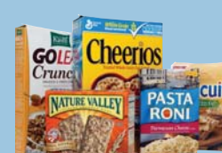
Paperboard (Cereal Boxes, etc.) Cartulina (Cajas de Cereal, etc.)

Return plastic shopping bags to participating stores for recycling. Regrese bolsas de plástico de compras a las tiendas participantes de reciclaje.