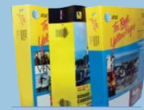
Phone Books Guías Telefónicas