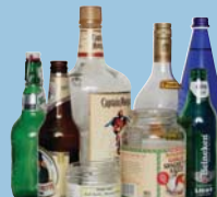
Glass Bottles, Jars Botellas, Frascos de Vidrio

Place these items in your Recycle Cart. Coloca estos artículos en tu bote de reciclaje.