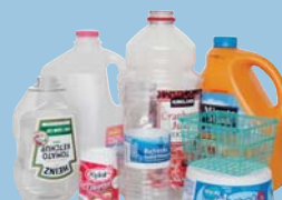
Plastics Plástico del