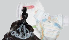
Diapers, Bagged Pet Waste Pañales, Bolsas de Excremento (Popó) de los Animales