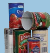
Steel Cans Latas de Acero