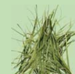
Grass Clippings Recortes del Pasto

Place these items in your Yard Waste Cart. Ponga estos artículos en su Bote de Basura del Jardín.