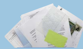
Office Paper Papel de Oficina