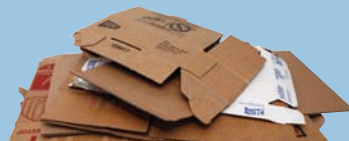
Flattened Cardboard Cartón Desarmado