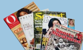
Magazines, Catalogs Revistas, Catálogos