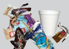
Styrofoam, Juice Boxes, Wrappers Estiroleno, Cajas de Jugo, Envoltorios