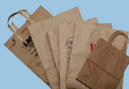
Brown Paper Bags Bolsas de Papel de Estraza