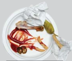
Food Waste, Soiled Paper Desperdicios de Comida, Papel Sucio

Por favor no olvide poner su basura y los desechos de sus mascotas en bolsas.