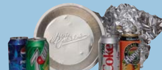
Aluminum Cans, Foil & Tins Latas, Papel, Moldes de Aluminio