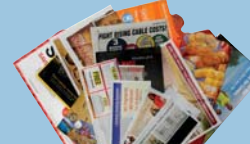
Junk Mail Correo de Propaganda