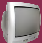
TVs, VCRs Televisiones, Videocaseteras