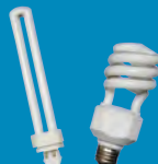
Fluorescent Light Bulbs Lámparas Fluorescentes