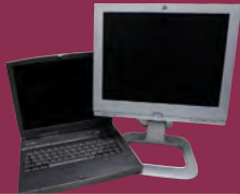
Computers, Monitors, Keyboards Computadoras, Monitores, Teclados