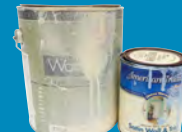
Latex Paint Pintura de Látex