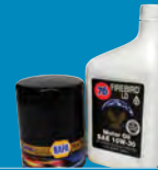
Used Motor Oil and Filters Aceite de Motor y Filtros Usados